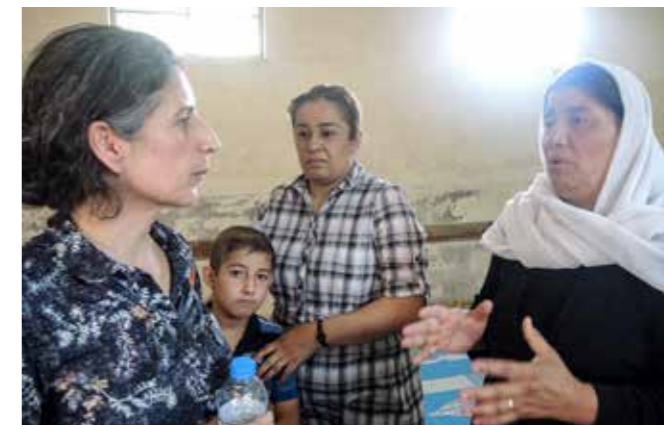
Irakiska flyktingar, fördrivna av framryckande islamistiska soldater.

inte enbart kristna. I Irak har jeziderna varit särskilt utsatta och de som kunnat har flytt vartefter IS ryckt fram. För dem, som av IS betraktas som otrogna, gäller omvändelse eller död. Alla som IS anser inte har sanningen flyr för sina liv.