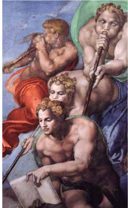
Michelangelo: Yttersta domen, detalj.