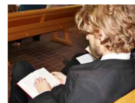
40 procent av svenskarna uppger att de tror på Gud.

de tror på Gud. Det är en minskning sedan 80-talet. Drygt 50 procent uppger att deras tilltro till kyrkan är ganska hög eller mycket hög. På 80-talet var samma siffra 37 procent.